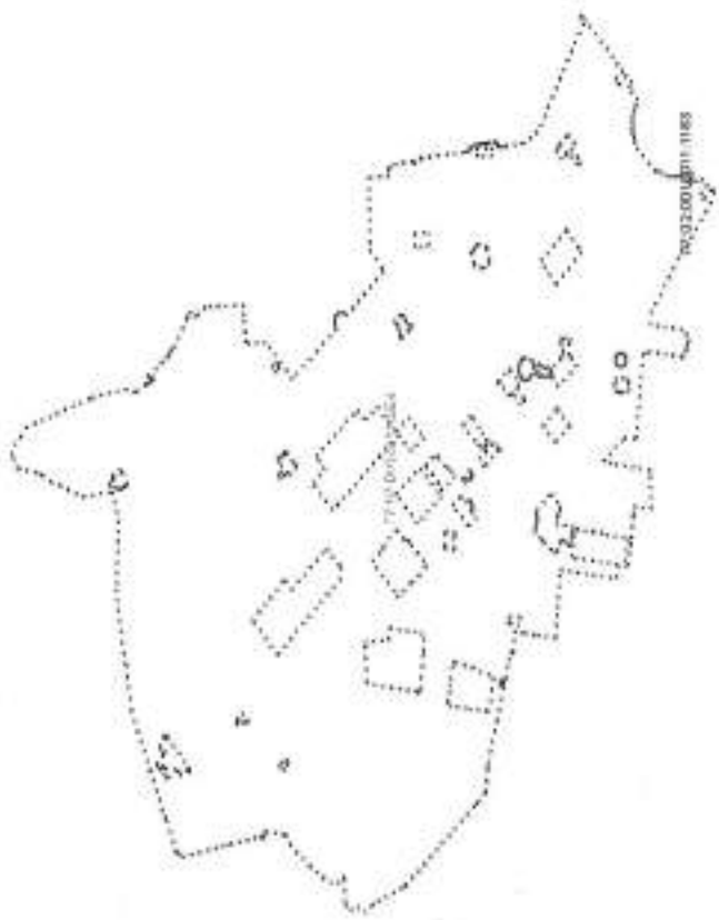
Схема расположения объекта недвижимости (части объекта недвижимости) на земельном участке(ах)