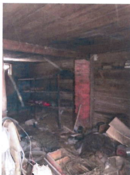
Вид помещений внутри