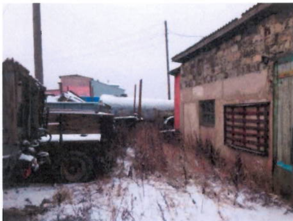
Общий вид здания