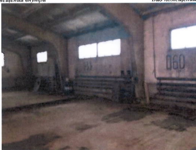
Вид помещений внутри