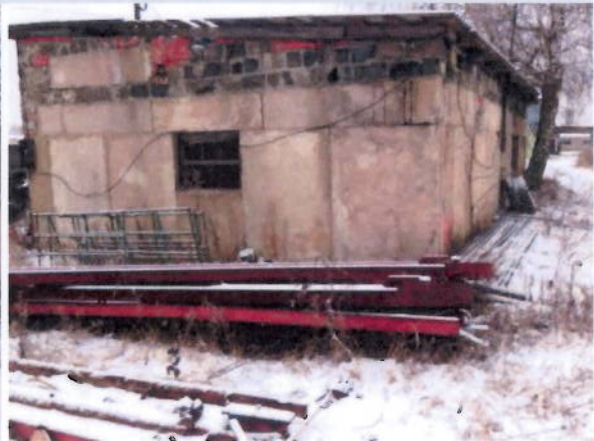
Общий вид здания