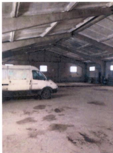
Вид помещений внутри