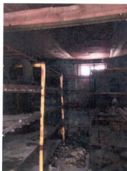
Вид помещений внутри