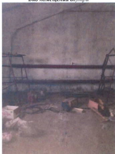
Вид помещений внутри