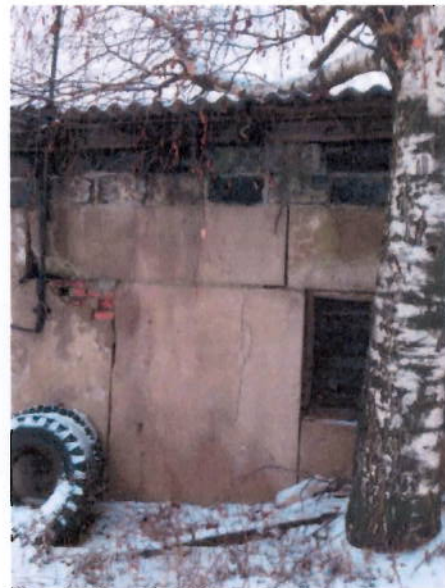
Общий вид здания