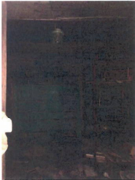
Вид помещений внутри