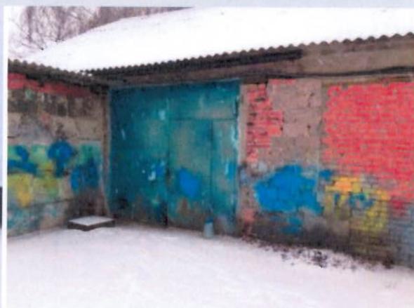
Общий вид здания