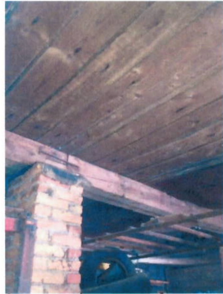
Вид помещений внутри

Ремонтно-механическая мастерская, 1-этажная, общая площадь 79,50 кв.м, инв. № 7497, лит. С, по адресу: Московская область, Шатурский район, Петровский с.о., д. Лешошево, территория гаража