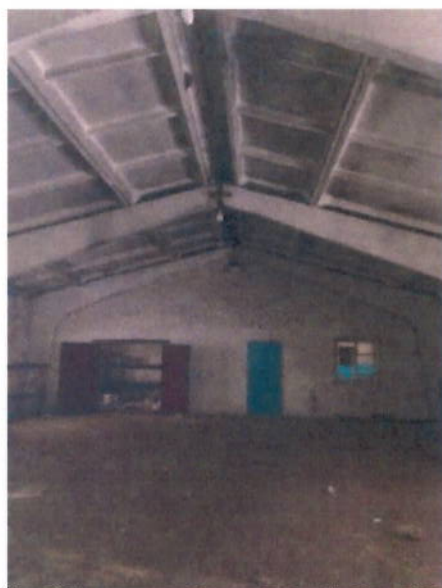
Вид помещений внутри