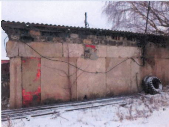
Общий вид здания

Ремонтно-механическая мастерская, 1-этажная, общая площадь 79,50 кв.м, инв. № 7497, лит. С, по адресу: Московская область, Шатурский район, Петровский с.о., д. Лешошево, территория гаража