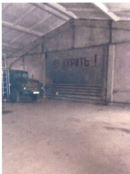
Вид помещений внутри