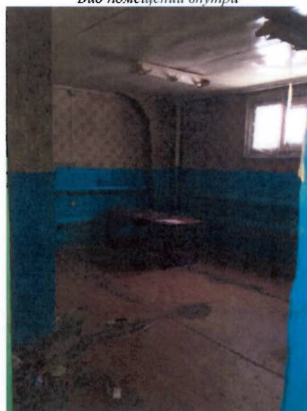
Вид помещений внутри