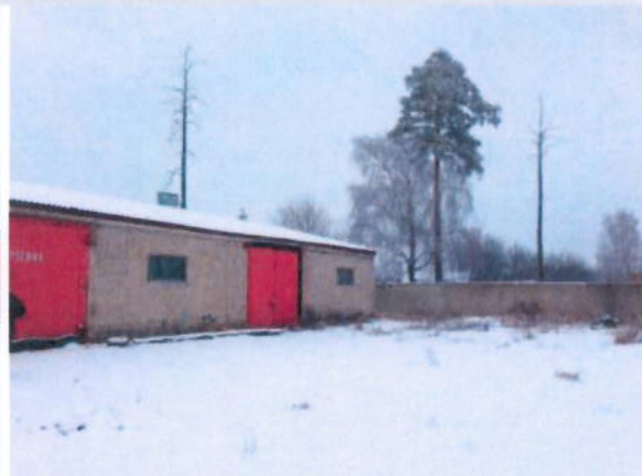
Общий вид здания