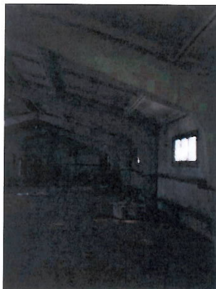
Вид помещений внутри

Теплая стоянка, 1-этажная, общая площадь 317,60 кв.м, инв. №7692, лит. А, А1, А2, А3, по адресу: Московская область, Шатурский район, Новосидоровский с.о., д. Ботино