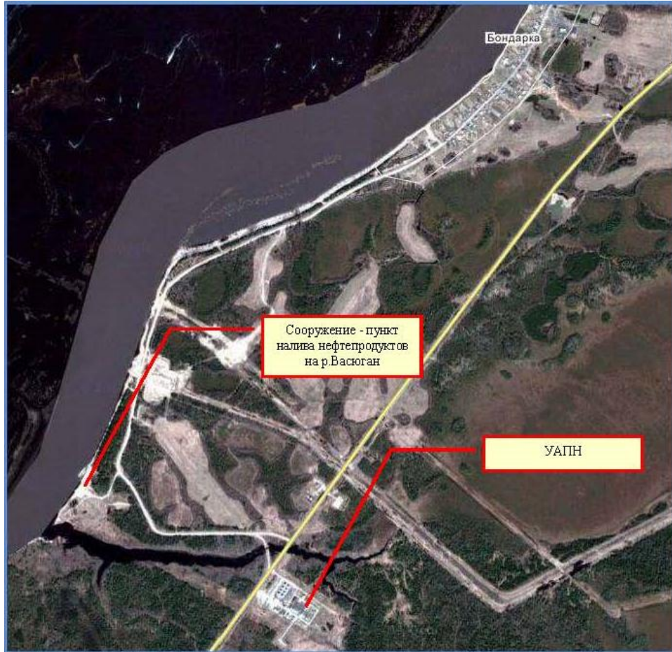
Схема расположения имущественного комплекса УАПН.